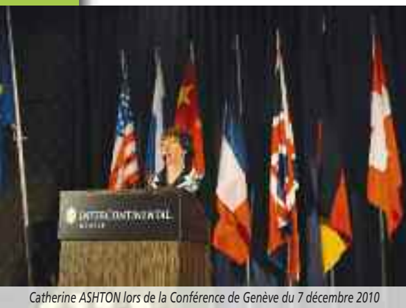
Catherine ASHTON lors de la Conférence de Genève du 7 décembre 2010