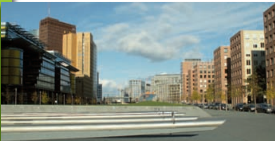
Potsdamer Platz - Berlin, 2001