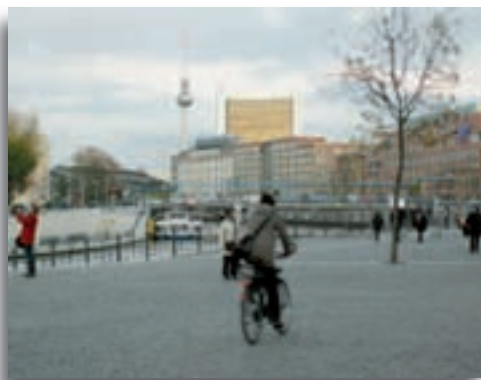
Quartier du Reichstag - Berlin, 2001

Le 9 novembre, les Berlinoises célèbreront une grande « Fête de la liberté » autour de la porte de Brandebourg.